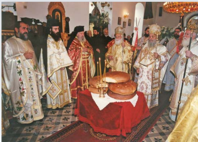
Γαβαλομούρι Κισάμου, 13 Νοεμβρίου 2001