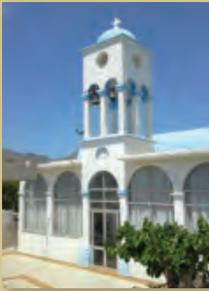
Ι.Ν. Αγ. Ἐλευθερίου & Αγ. Ἀντωνίου στό Νιό Χωριό

σα καθώς και χώρος διαμορφωμένος για έκδηλώσεις που χρησιμοποιείται και από τον πολιτιστικό σύλλογο της Γραμβούσας.