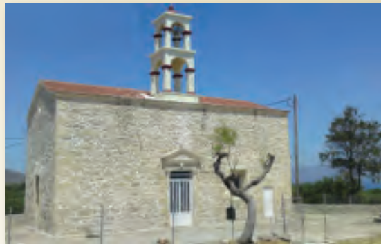
Ἱ.Ν. Ἁγ. Γεωργίου Κουτουφιανῶν

Ἡ ἐκκλησία διέθεσε τμήμα οἰκοπέδου δίπλα στόν ναό, γιά νά κατασκευαστεῖ σχολεῖο. Τώρα στεγάζεται ἐκεῖ τό Ε.Ε.Ε.Ε.Κ. Κισάμου. Ὑπάρχει ἐπίσης ἐνοριακή αἶθου-