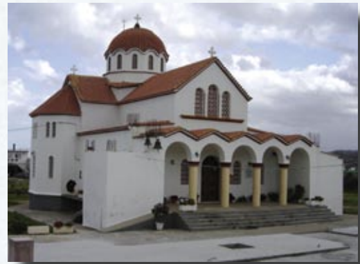
Ό 'Ι.Ν. τῆς Αγ. Μαρίνης

Μέ τήν συνεισφορά τής 'Ιερῆς Μονῆς Γωνιάς καί τών κατοίκων του χωριού οι έργασίες τής ανοικοδόμησης του ναού προχωροῦσαν μέ ταχύτατους ρυθμούς, είχε άλλωστε ό αρχιτέκτονας περισσότερους από πενήντα βοηθούς. Στίς 12 'Ιουνίου 1881 ό θόλος του κυρίως Ναού «κλείνει» παίρνοντας ό αρχιτέκτονας ως δώρο τό ποσό τών 107,20 γροσιών. Τό έτος 1887 ό ναός