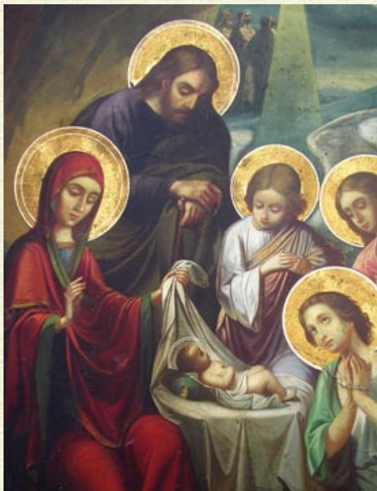
Ἡ Γέννησις. Φορητή εἰκὼν. Ἰ.Ν. Μιχαήλ Ἀρχαγγέλου Ρόκας Κισάμου