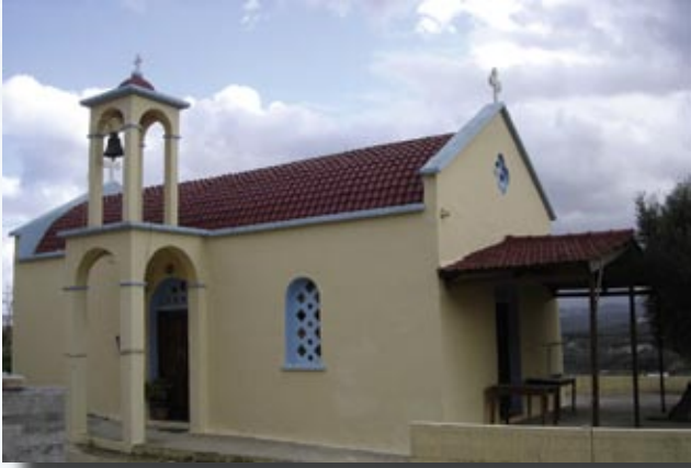
Ὁ Ἱ.Ν. τοῦ Ἀγ. Νικολάου

Ἡ Ἐνορία Κολυμβαρίου ἔχει τήν εὐλογία νά γεινιάζει μέ τήν Ἱερά Μονή Ὁδηγήτριας ἤ Γωνιάς. Ἡ συμβολή τῆς Μονῆς στήν ἱστορία καί στή ζωή τῶν κατοίκων τοῦ Κολυμβαρίου ἀλλά καί τῆς εὐρύτερης περιοχῆς θεωρεῖται ἀναμφισβήτητη.