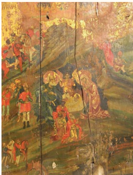
Ἡ Γέννησις. Φορητή εἰκὼν. Ἰ.Ν. Μεταμ. Σωτήρος Βουλγάρω Κισάμου

Ἰά ἄλλη μιά φορά, ἀγαπητοί μου ἀδελφοί καί φίλοι τοῦ Σαρκοφορεμένου Θεοῦ μας, γινόμεθα μάρτυρες καί μέτοχοι τοῦ με- γάλου καί κοσμοσωτήριου γεγονότος τῆς Ἐνανθρωπήσεώς Του. «Ὁ Λόγος σὰρξ ἐγένετο καί ἐσκήνωσεν ἐν ἡμῖν». Τό ταπεινό σπήλαιο γίνεται καί πάλιν οὐρανός καί ἡ φάτινη του δέχεται τόν Ἀχώρητο Θεό. Ἡ Χριστιανοσύνη ὅλη καί μαζί τῆς ὀλόκληρη ἡ ἀνθρωπότητα, φωτίζεται ἀπό τόν νοη- τό Ἥλιο τῆς δικαιοσύνης, ὁ Ὅποιος «ἐπεσκέψατο ἡμᾶς ἐξ' ὕψους ὁ Σωτήρ ἡμῶν». Ἀπροσμέτρητης ἀγάπης θαῦμα ἡ Σάρκωση τοῦ Θεοῦ. Εἶναι ὁ Θεός ὅλου τοῦ κόσμου, ὁ Θεός τοῦ ἀνθρώπου, ὅλος ἀγάπη, ὅλος καλωσύνη. Ἔρχεται νά ζήσει τήν πτῶχεια καί τόν πόνο, τήν πικρία καί τήν παρα- γνώριση, τήν ἀδικία καί τόν κατατρεγμό. Ἔρχεται ὁμως καί νά γκρεμίσει τό μεσότοιχο τοῦ φραγμοῦ πού εἶχε ὑψώσει ἡ ἀλαζονεία τοῦ ἀνθρώπου καί νά συμφιλώσῃ τόν ἄνθρωπο μέ τόν Θεό. Γιατί ἡ Ἐνανθρώπιση τοῦ Υἱοῦ καί Λόγου τοῦ Θεοῦ δέν γίνεται γιά νά δείξει τήν δύναμη καί τήν ἐξουσία