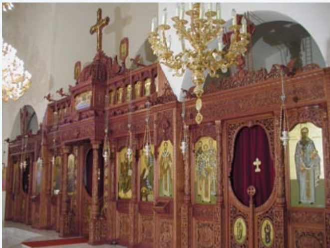
Τό ἐσωτερικό τοῦ Ἱ.Ν. Ἀγ. Μαρίνης

Ἔτσι μέ τήν παραχώρηση ἀπό τήν Ἱ.Μ. Γωνιάς ἡ Ἐνορία ἀπέκτησε στίς 14 Ἰανουαρίου 1992 οἰκόπεδο τεσσάρων στρεμμάτων ὑπό τήν μορφή τῆς ἀνταλλαγῆς. Στίς 20 Αὐγούστου 1993 ὁ πρῶν Μητροπολίτης Κισάμου & Σελίνου κ.κ. Εἰρηναῖος θεμελίωσε τό νέο Ναό. Μέ τήν συμβολή τῆς Ἱερᾶς Μητρόπολης, τόν ἀγῶνα τῆς ἐρανικῆς ἐπιτροπῆς καί τήν συμπαράσταση τῶν κατοίκων ὁ ναός θά