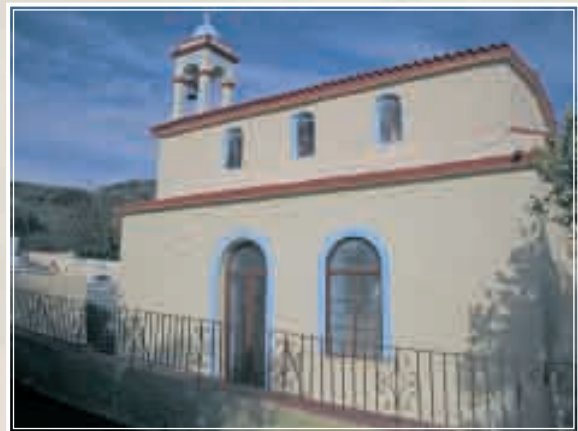
Ὁ Ἱ. Ν. Γενεσίου τοῦ Προδρόμου Βασιλειανῶν

γ) Ἁγίου Δημητρίου στά Φουριανὰ (26 Ὀκτωβρίου). Ὁ ναός αὐτός ἀναστηλώθηκε στίς ἀρχές τῆς δεκαετίας τοῦ 1990