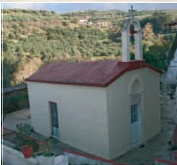
Ὁ Ἱ. Ν. Πέτρου καί Παύλου Καρῶν

β) Ἁγίου Ἀντωνίου στίς κάτω Καρές (17 Ἰανουαρίου), ὁ