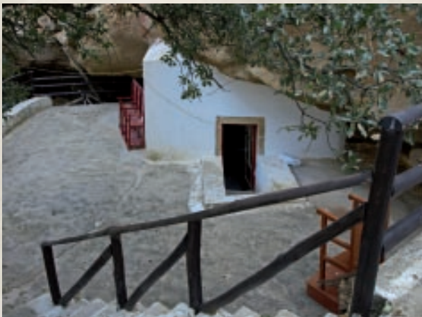
Ὁ σπηλαιώδης Ἱ.Ν. Ἀσρατήγου Ποταμίδας