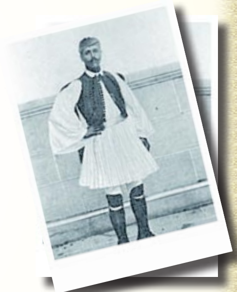
Σπύρος Λούης (1896)

Μέ την συνεπικουρία του Δημητρίου Βικέλα, την πρόθυμη χρηματοδότηση Έλλήνων της διασποράς και την παλλαϊκή συμμετοχή ή μικρή Ελλάδα του 1896