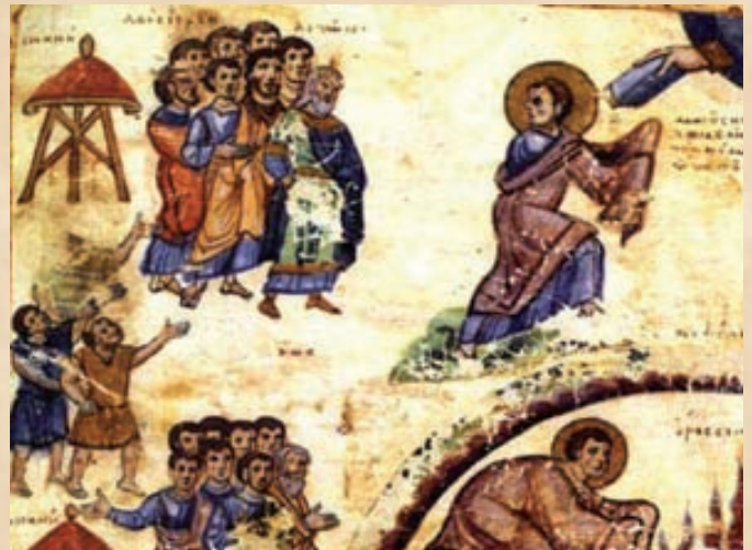
Ο Λαός του Ίσραήλ στο Σινά και ή Παραλαβή του Νόμου άπό τον Μωϋσή, Μικρογραφία Χειρογράφου, 11ος αι

όπως, άς πούμε, μάς φέρνει σιγά σιγά στο φώς για να το συνηθίσουμε, άν προηγουμένως τα μάτια μας μείνουν πολύ στο σκοτάδι. Γιατί γνωρίζει τις άδυναμίες μας και με την άνεξιχνίαστη δικαιοκρισία του, μέσα στο βάθος και στον πλούτο της σοφίας του, μάς δίδαξε αυτόν τον βατό και ταιριαστό σ' έμάς δρόμο, συνηθίζοντάς μας προηγουμένως να βλέπουμε τις σκιές των σωμάτων και τον ήλιο μέσα από το νερό, για να μη "τυφλωθούμε" από τη θέα του λαμπρού φωτός. Κατά την ίδια έννοια και ο νόμος "όντας σκιά των μελλόντων", και ή προτύπωση μέσω των προφητών, ή όποια είναι ύπαινιγμός για την άλη-