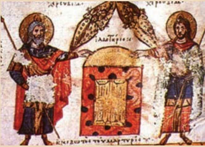
Ο Προφήτης Μωυσής, ο Προφήτης Ααρών και η Σκηνή του Μαρτυρίου. Μικρογραφία Χειρογράφου, 11ος αι.