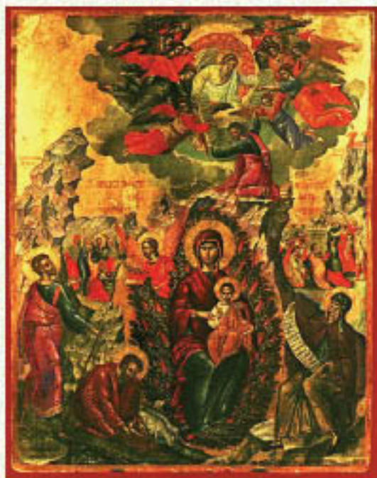
Θεοτόκος ἡ Βάτος, Ἁγ. Μηνῶς Ἡρακλείου

«Ὁπου ἐπισκίαση ἡ χάρις σου, Πανάχραντε,