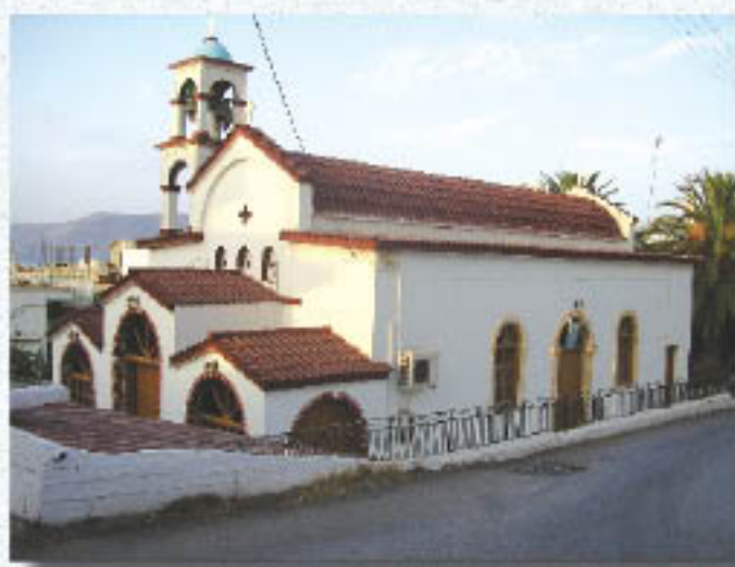
Ὁ Καθεδρικός Ἱ.Ν. Ἀγ. Γεωργίου

Ὅλα τά ἄλλα εἶδη, εἰκόνες, σκεύη, ἱερά βιβλία, πού κοσμοῦν τόν Ἅγιο Γεώργιο, προσφέρθηκαν ἢ ἀγοράσθηκαν ἀπό τούς χριστιανούς καί τά ἐκάστοτε