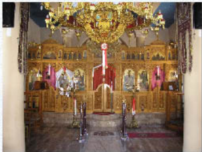
Τό έσωτερικό τού Ι.Ν. Άγ. Γεωργίου