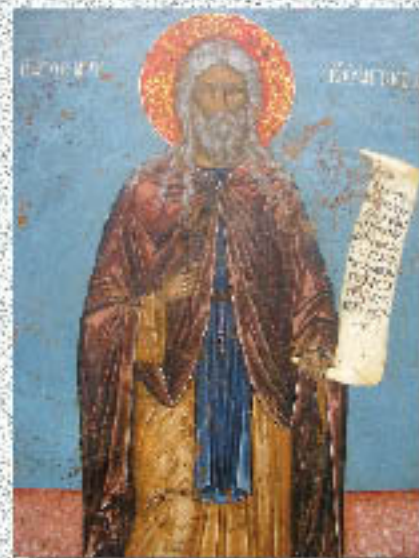
Ο Όσιος Κύρ Ιωάννης ο Ξένος

«Ο Χριστιανισμός, μου είπε πρόσφατα κάποιος καλοπροαίρετος συνομιλητής, είναι ένα φιλοσοφικό-ιδεολογικό σύστημα, όπως τόσα άλλα, γι' αυτό κι έχει γίνει - έθιμο». Κι εγώ δανειζόμενος τα λόγια του α. Γιαρουσκύ απήτησα: «Η Έκκλησία δέν μάς δίνει ένα σύστημα, αλλά ένα κλειδί. Δέν μάς δίνει ένα σχέδιο της Πολιτείας του Θεού, αλλά τό μέσον, γιά νά μπούμε σ' αυτήν. Ίσως, συνέχισα, κάποιος χάσει τόν δρόμο του, γιατί δέν έχει σχέδιο. Άλλά ό,τι δει θά τό δει, δίχως μεσολαβητή, θά τό δει άμεσα, θά είναι πραγματικό γι' αυτόν. Ένώ αυτός που έχει μελετήσει μόνο τό σχέδιο, κινδυνεύει νά μείνει άπ' έξω και νά μή βρει πράγματι τίποτα». Δέν ξέρω άν τόν έπεισα, γνωρίζω όμως καλά πώς δέν μπορεί νά αμφισβητήσει κανείς τό βίωμα άσκητικών μορφών της Έκκλησίας, που, όταν τούς έπισκεπτόταν στα άσκητάρια τους και τούς ρωτούσαν: «Γιατί κάθεται εδώ;» άπαντούσαν: «Δέν κάθομαι. Ταξιδεύω». Γιατί ό Χριστιανισμός είναι ή όδός της ζωής. Και ή Όρθοδοξία στον σύγχρονο κόσμο είναι πράγματι «ένα παλιό δένδρο», αλλά υπάρχει ακόμη ή ζωτικότητα, μία «συνεχής ανάσταση», κι αυτό είναι που άξιζει και όχι μόνη ή αρχαιότητα.