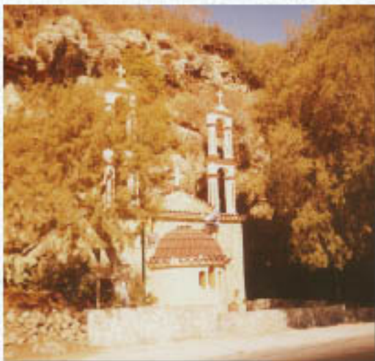
Ό Ί.Ν. του Τιμίου Προδρόμου (Ντάμιαλη) Παρεκκλήσιον της Ένορίας

Ό Ίερός Ναός του Άγίου Νικολάου, είναι παλαιός ναός, πετρόκτιστος, Βασιλικού ρυθμού, με σκέ-