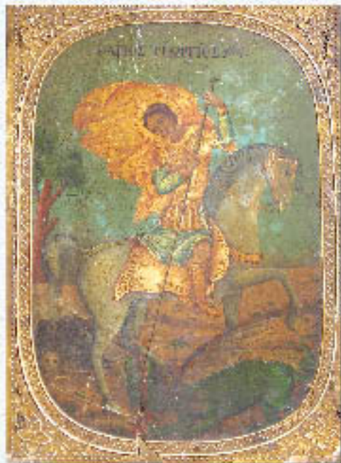
Ἡ Εἰκόνα τοῦ Ἁγίου Γεωργίου