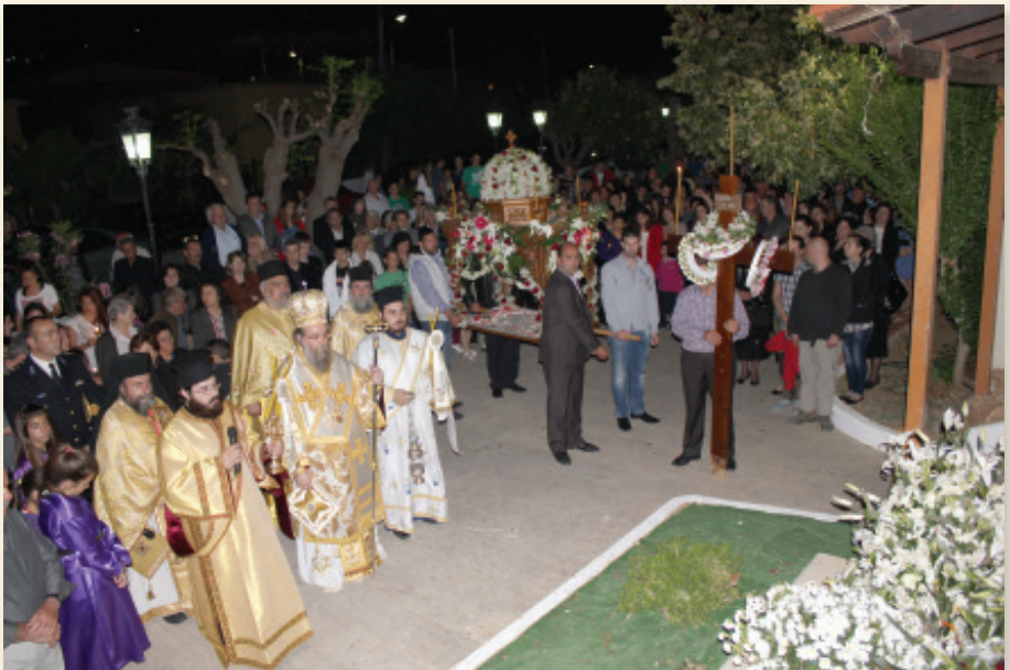
Μ. Παρασκευή: Από τό τρισάγιο πού τελέστηκε στόν τάφο του αιδίμου Μητροπολίτου