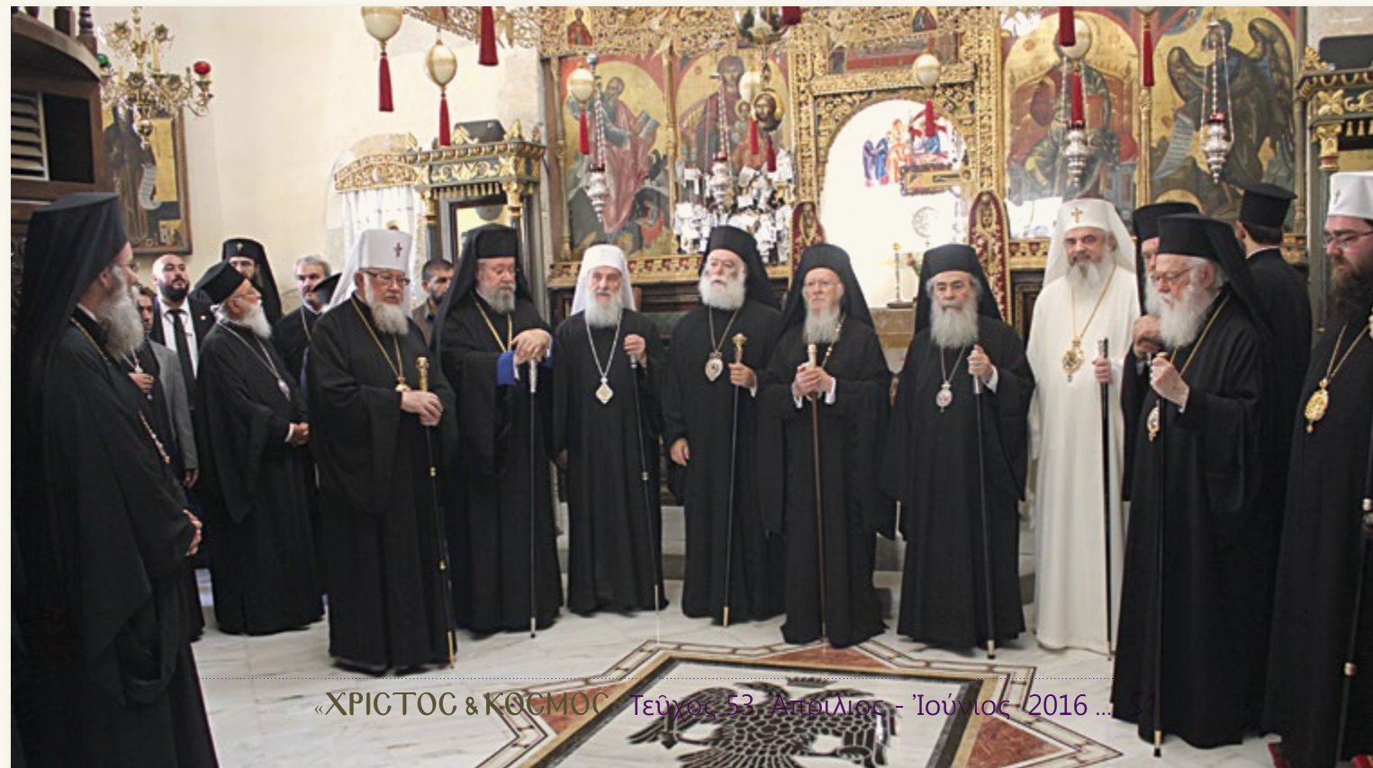
«ΧΡΙΣΤΟΣ & ΚΟΣΜΟΣ» Τεύχος 53, Ἀπρίλιος - Ἰούνιος 2016 ...