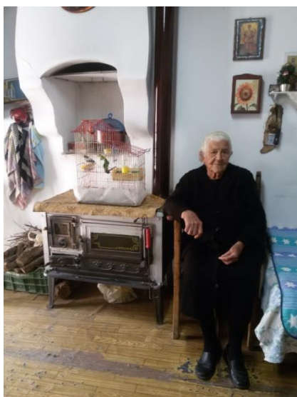
Εξυπηρετούμενη προγράμματος «Βοήθεια στο σπίτι Κισάμου»

Η βελτίωση του βιοτικού επιπέδου των ηλικιωμένων και των Α.Μ.Ε.Α, η προαγωγή της παραμονής τους στο οικείο φυσικό και κοινωνικό τους περιβάλλον, η διατήρηση της συνοχής της οικογένειας, η αποφυγή της χρήσης ιδρυματικής φροντίδας ή καταστάσεων κοινωνικού αποκλεισμού και η εξασφάλιση αξιοπρεπούς και υγιούς διαβίωσης.