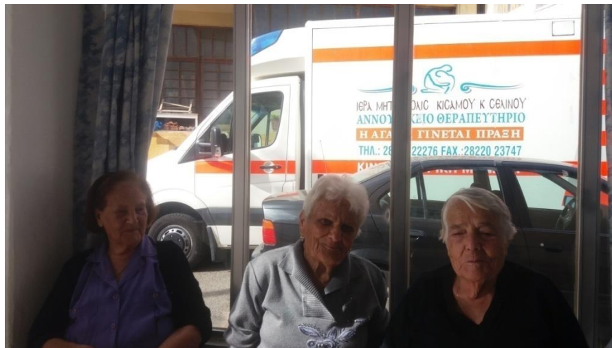
Αναμένοντας την Ιατρική Εξέταση στην Κινητή Ιατρική Μονάδα

Τα προγράμματα «Βοήθεια στο σπίτι» συνεχίζουν την διοργάνωση κοινωνικών δράσεων με την Κινητή Ιατρική Μονάδα του Αννουςακείου Ιδρύματος: