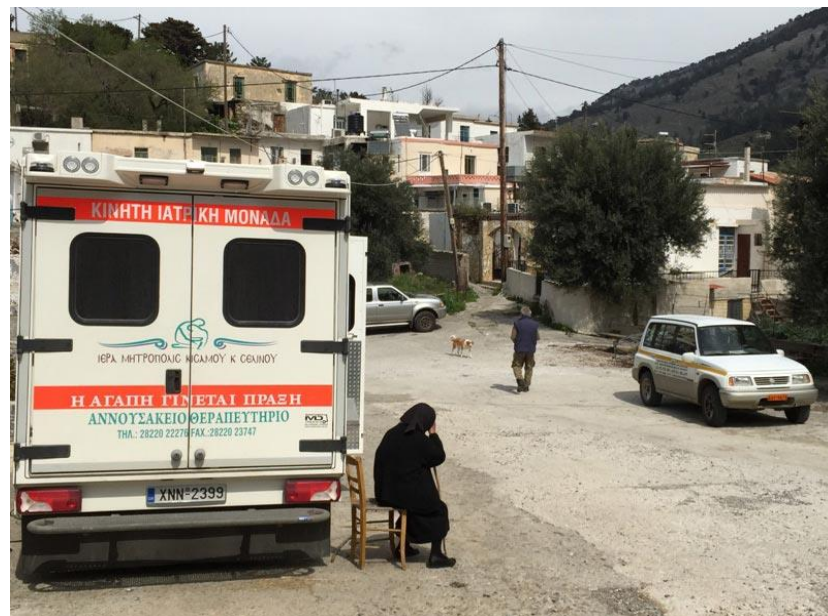
Η Κινητή Ιατρική Μονάδα στο Κουστογέρακο