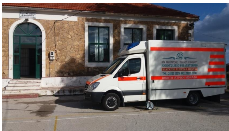
Η Κινητή Ιατρική Μονάδα στο Δημοτικό Σχολείο Σφακοπηγαδίου

Το πρόγραμμα «Βοήθεια στο σπίτι Σέλινου» προέβει στη διοργάνωση εκδήλωσης κοπής Πρωτοχρονιάτικης Βασιλόπιτας στο ενοριακό κέντρο Καντάνου, παρουσία του Σεβασμιότατου Μητροπολίτη Κισάμου και Σέλινου, Προέδρου Δ.Σ. του Αννουσακείου Ιδρύματος κ. Αμφιλοχίου, άλλα και όλων των τοπικών αρχών.