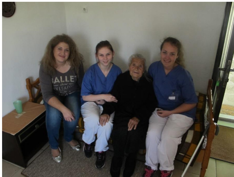
Εξυπηρετούμενη προγράμματος «Βοήθεια στο σπίτι Κισάμου» με σπουδαστές Νοσηλευτικής από την Νορβηγία