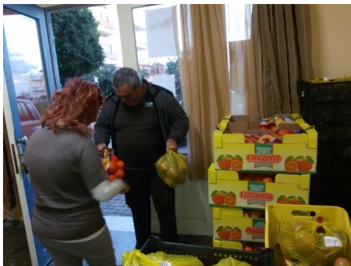
Διανομή Τροφίμων κ.α. αγαθών από το Κοινωνικό Παντοπωλείο