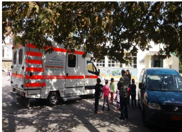
Η Κινητή Ιατρική Μονάδα στο Δημοτικό Σχολείο Έλους