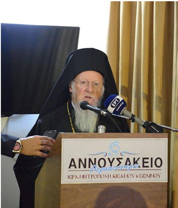
Η Α.Θ.Π. Ο Οικουμενικός Πατριάρχης κ.κ.Βαρθολομαίος