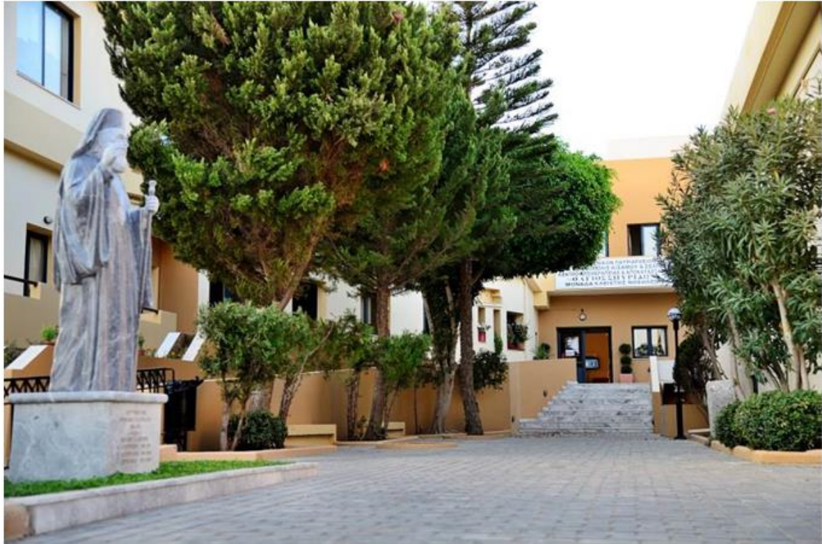
Είσοδος Αννουσάκειου Θεραπευτηρίου