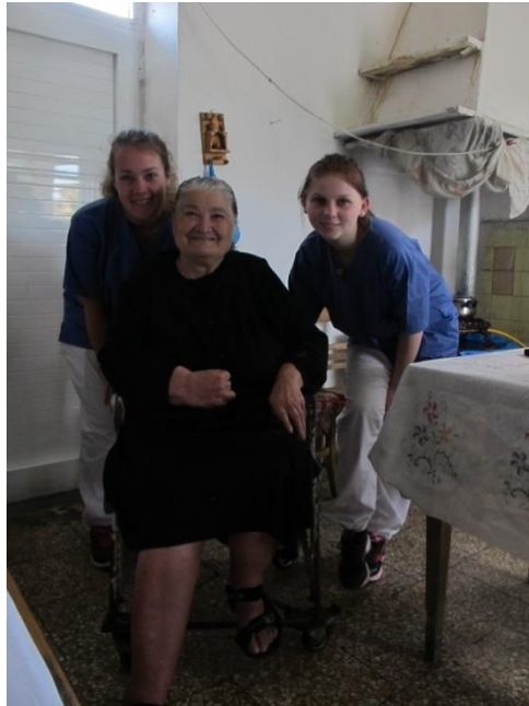
Εξυπηρετούμενη προγράμματος «Βοήθεια στο σπίτι Κισάμου» με σπουδαστές Νοσηλευτικής από την Νορβηγία