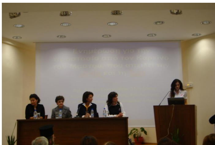
Ομιλία για την πρόληψη του καρκίνου του μαστού στο Φαλδάμειο Οίκημα της Ι.Μ.Κ.Σ