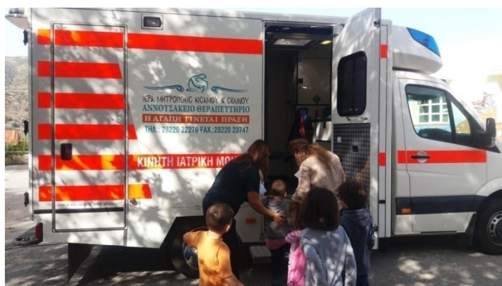
Η Κινητή Ιατρική Μονάδα στο Δημοτικό Σχολείο Έλους