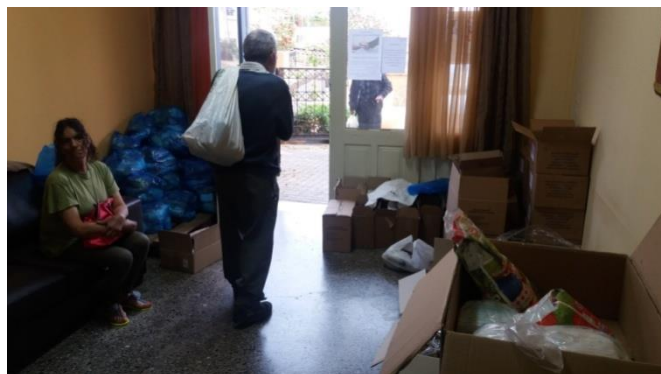
Διανομή Τροφίμων από το Κοινωνικό Παντοπωλείο