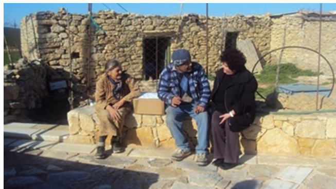
Συζήτηση, Συμβουλευτική με την Κοιν. Λειτουργό προγράμματος «Βοήθεια στο σπίτι Σελίνου» με ζευγάρι ηλικιωμένων στην Γαύδο